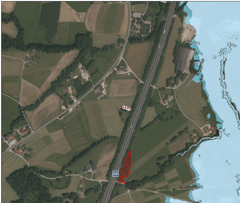
Gefahrenzonenplan_GSt. 1486/22

Besondere Informationen: Die Liegenschaft wird verkauft wie sie liegt und steht. Für allfällige Altlasten wird seitens ASFINAG keine Haftung übernommen.