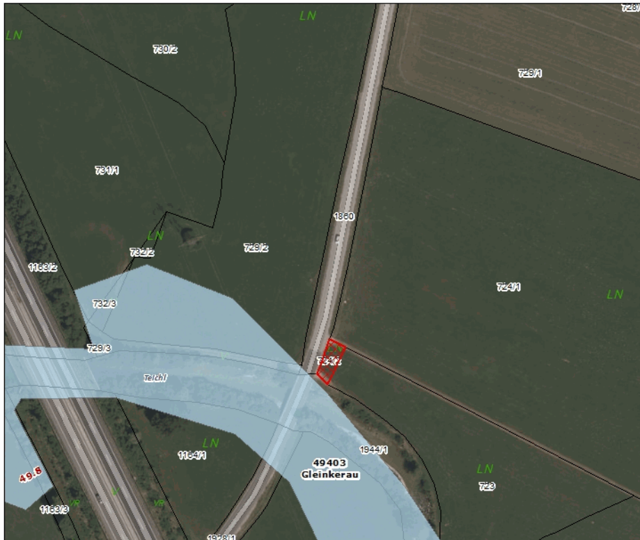
Hochwasserrisikozonierung_GSt. 724/2